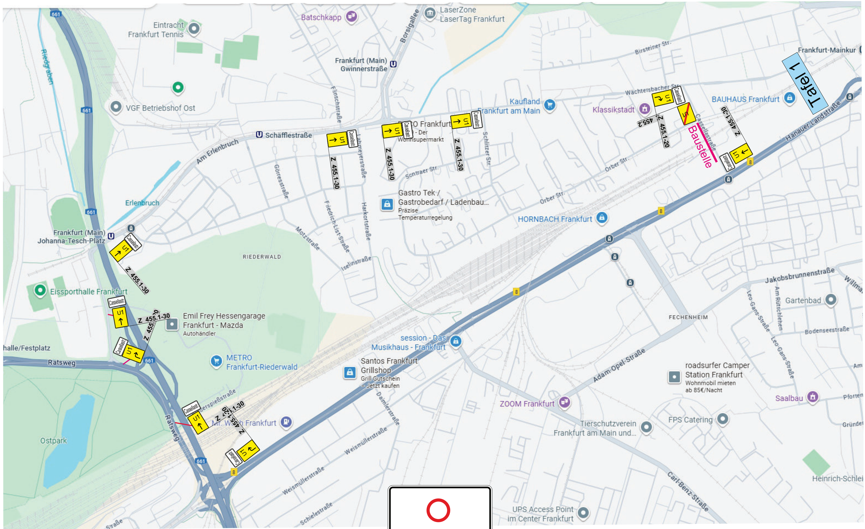
Tafel 1 1600 x 1250 mm