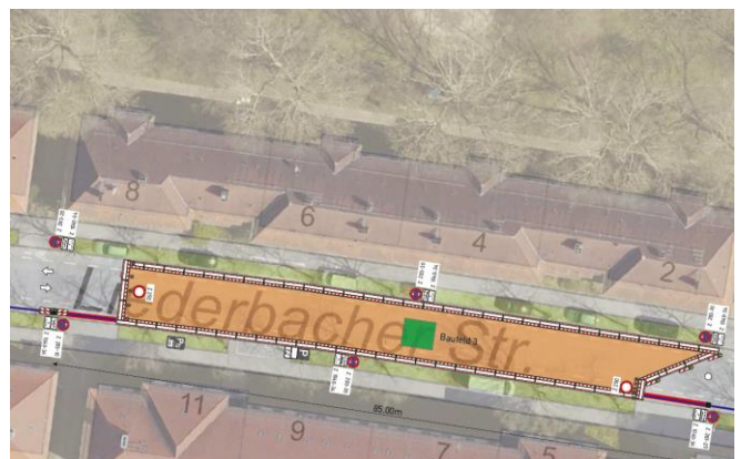
Vollsperrung Liederbacher Straße Nr. 2-8: