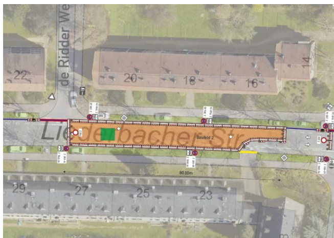
Vollsperrung Liederbacher Straße Nr. 16-20: